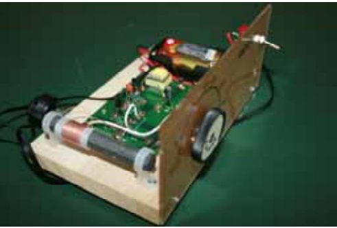
2石トランジスタラジオ完成図